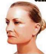
KEHILANGAN gigi punca otot muka menyusut.