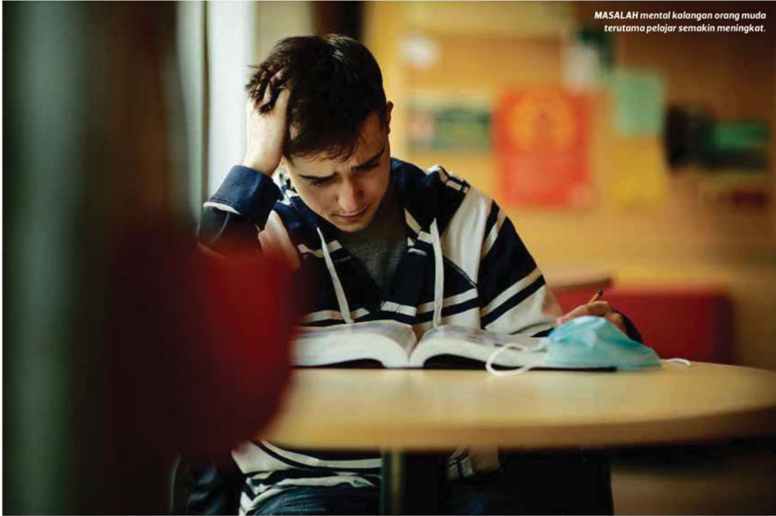
MASALAH mental kalangan orang muda terutama pelajar semakin meningkat.

Lebih merisaukan adalah peningkatan berterusan dalam kes yang dilaporkan iaitu daripada 10.6 peratus pada 1996 kepada 29.2 peratus pada 2015, ia membabitkan individu berusia 16 tahun